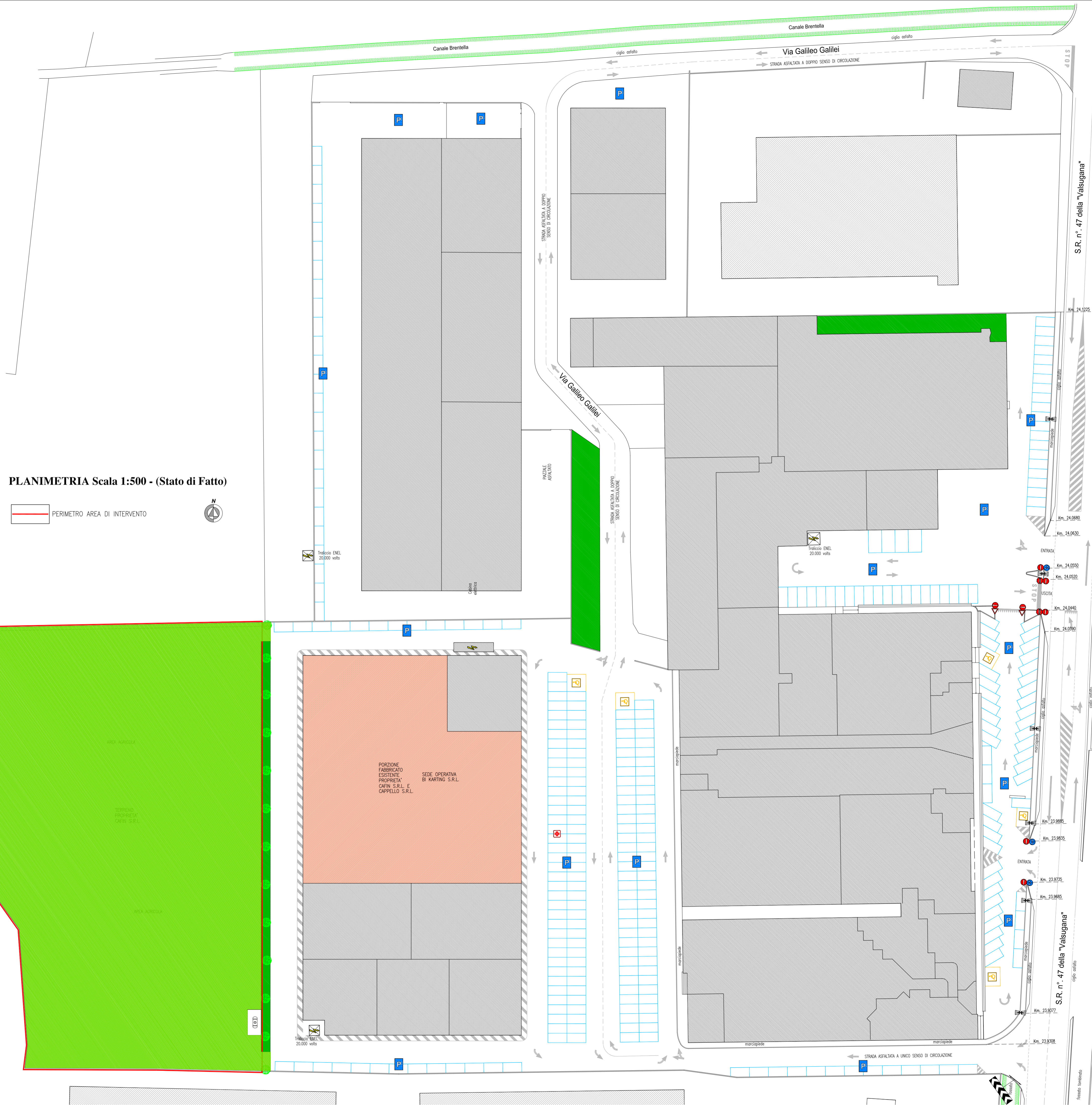
PLANIMETRIA Scala 1:500 - (Stato di Fatto)